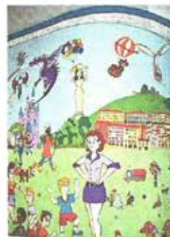
Il murales alla ludoteca.