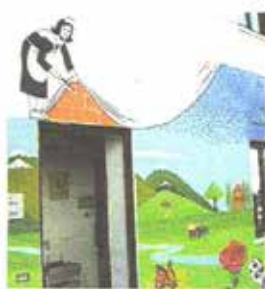
Un particolare del murales. S. S.

Molte le autorità presenti, tra l'emozione e anche la commozione di ragazzi e genitori.